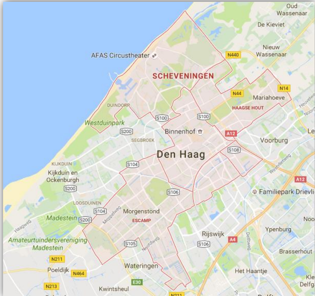
GI-gebied Den Haag (google maps, bewerking ERAC)